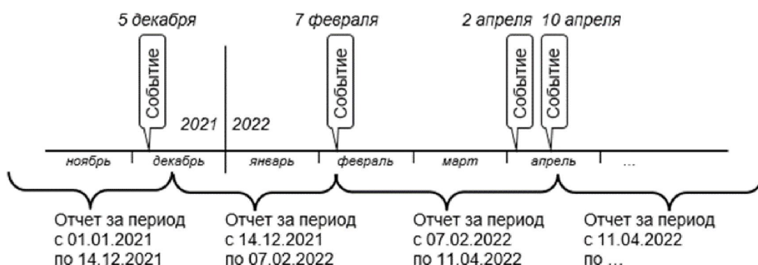
Рисунок 1. Схема определения даты окончания периодов оперативной отчетности

На рисунке 1 представлена схема определения даты окончания периодов оперативной отчетности.